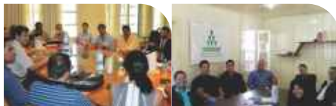
RIO GRANDE DO SUL