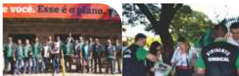
MATO GROSSO DO SUL